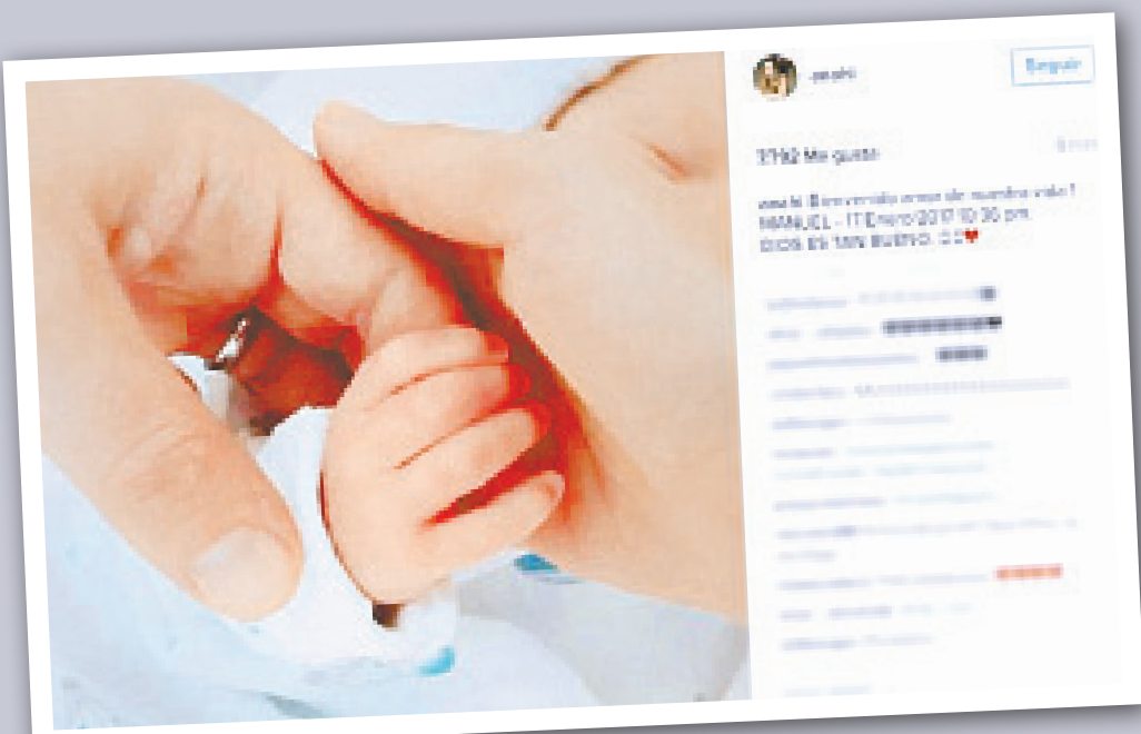
ANAHÍ publicó la primer foto del nuevo integrante de la familia.