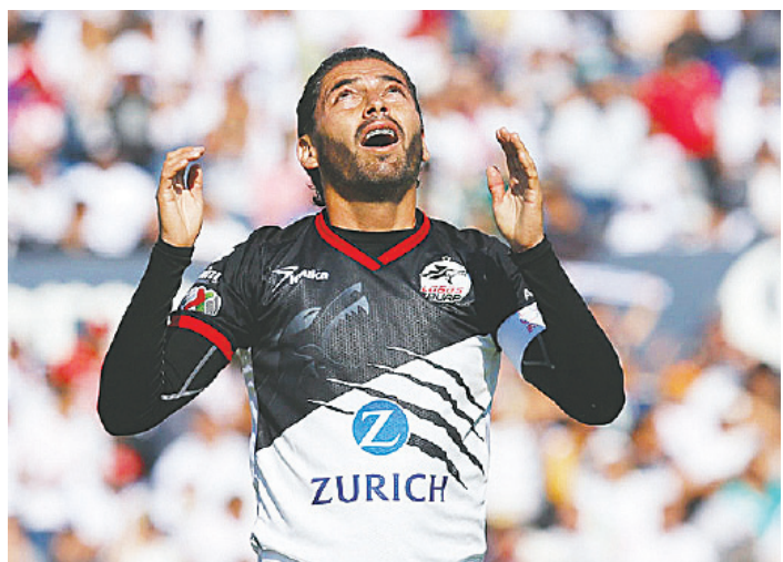
LOBOS BUAP CUMPLIÓ con lo exigido por la Liga MX y continuará en el máximo circuito.

Cafetaleros de Tapachula, que obtuvieron el ascenso, no obtuvo la certificación para llegar al máximo circuito.